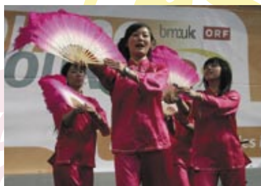
DER CHINESISCHE TANZ MIT DEM DRACHEN BRACHTE GLÜCK INS MUSEUMSQUARTIER, WO DIE ABSCHLUSSVERANSTALTUNG DER DIALOG-TOUR STATTFAND.