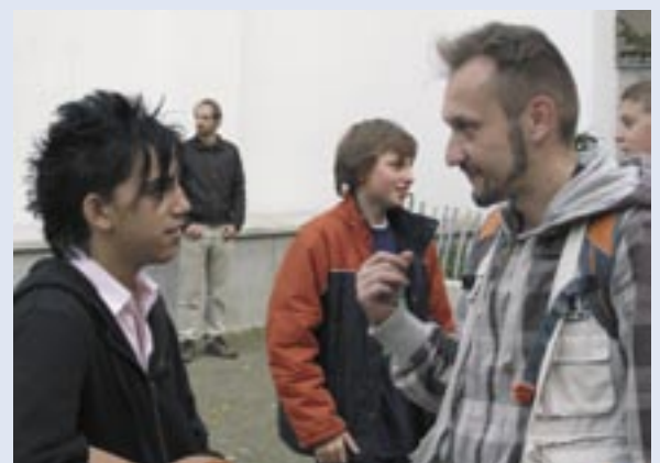
„KOMMUNIKATION“: EIN EINFACHES GESPRÄCH WIRKT OFT WUNDER....