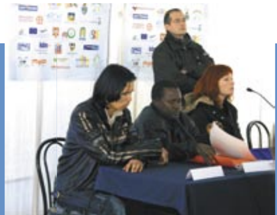
UM EINEN TIEFEREN EINBLICK IN DIE THEMEN Z.B. IMMIGRATION ZU ERMÖGLICHEN, KAMEN AM VORMITTAG EXPERTINNEN UND BETROFFENE ZU WORT. HIER SPRACHEN FLÜCHTLINGE ÜBER IHRE ERFAHRUNGEN.

Die Jugendlichen haben die Diskussions-Themen schnell bestimmt: Migration und Asyl, Suchtmittelkonsum und Gesundheits-