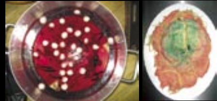
WER TRAUT SICH ZUZUGREIFEN: GESPALTENES GEHIRN, DEN AMPUTIERTEN FUSS VON FRANKENSTEIN, MONSTERAUGENBOWLE UND EISKALTE HÄNDCHEN DAS STAND ALS HALLOWEENMAHL ZUR AUSWAHL.

KARAOKE: HÜBSCHE HALLOWEEN-HEXEN GEBEN IN DER KARAOKEBAR SUBWAY GESANGLICH IHR BSESTES